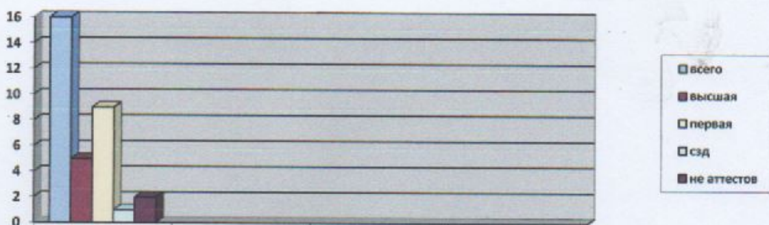
Анализ состава педагогических кадров по стажу.